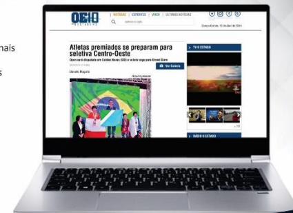
O Estado MS

"...possuem experiências em campeonatos nacionais e se consagraram campeões em vários deles".