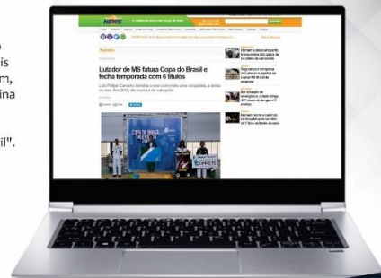
Campo Grande News

"O representante do Estado termina o ano como campeão de seis torneios: o Grand Slam, Brazil Games, Argentina Open, Centro-Oeste Open, Brazil Open e agora a Copa do Brasil".